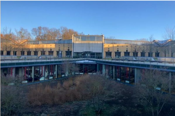
Blick auf die naturwissenschaftlichen Räume

Die Unterrichtsräume sind in sehr gutem Zustand und haben mit ca. 65qm eine schöne Größe. Durch hohe Gewölbedecken und loftartige Strukturen entsteht eine besondere Lernatmosphäre. Auch ein Lernforum (offener Bereich für selbständiges Lernen) wird eingerichtet. Informatikräume und Sportanlagen sind sehr gut ausgestattet.