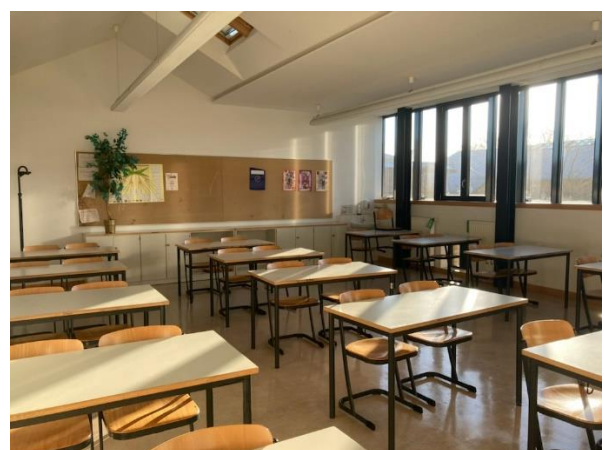
typischer Unterrichtsraum im OG