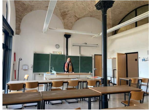
aktuelle Ausstattung im EG